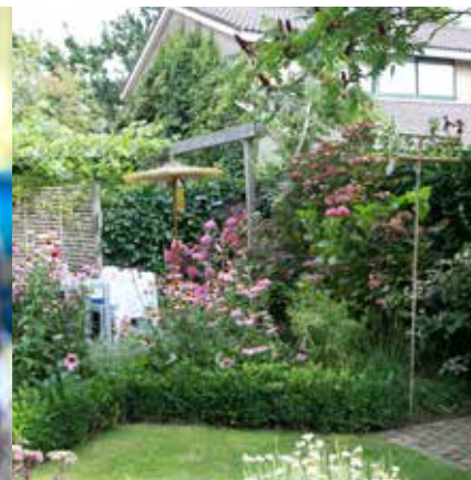
Tios del e nonse volorem