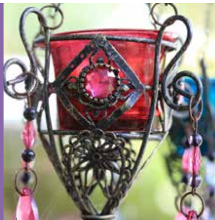
Optatas moluptatusae et harum aut

Vanaf het vlinderterras en het door Buxus omzoomde graspleintje geniet je volop van de bloemenzee in de border. Alle bloemen zijn aantrekkelijk voor vlinders, dat geldt zeker voor de rode zonnehoed, vetkruid en lavendel. Wil je vlinders naar je tuin lokken, zorg dan voor afwisseling in de bloeitijd, vanaf april tot oktober zijn er dan op warme dagen vlinders te zien. Voorjaarsbloeiers zoals Aubrieta , judaspenning ( Lunaria ) en damastbloem ( Hesperis ) mogen in een vlindertuin niet ontbreken. Plant voor het najaar vetkruid ( Sedum ), Liatris en herfstasters.